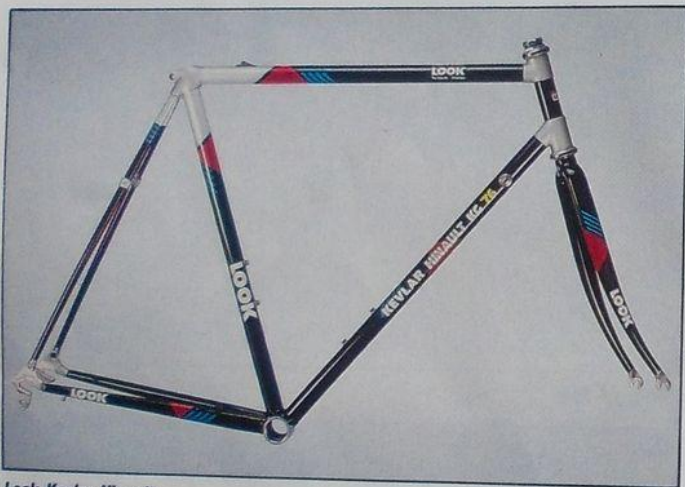
Look Kevlar Hinault.