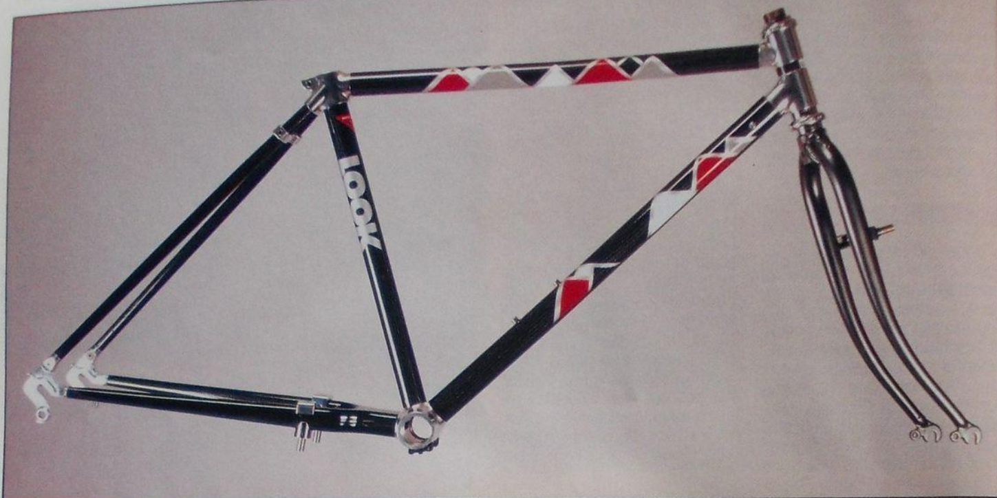
Look Aventure AV 86.