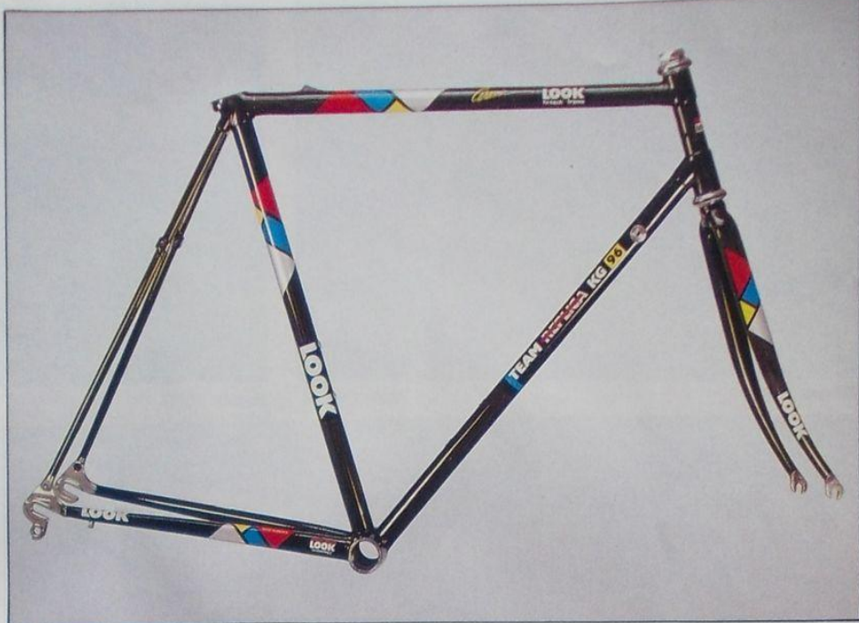
Look Team Replica.

La estrella de Look. Pesa 1.740 gramos y un precio que se acerca a un cuarto de millón de pesetas. Lleva cinco capas de carbono kevlar y dos de cerámica (que aporta rigidez en las zonas en las que el cuadro sufre un mayor estrés: racores de dirección, sillín y caja del pedalier y la horquilla). Esta bicicleta, que es la que usan, entre otros, Lejarreta, Jean-François Bernard y Cabestany, destaca por su excelente rigidez, que contrasta con su alto índice de nerviosidad (capacidad de retorno de un material ante una tensión determinada; por ejemplo, un bache de la carretera). Es un cuadro de alta competición, por lo que la comodidad no es cuestión prioritaria. Por último, desta-