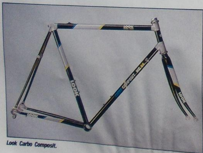
Look Carbo Composit.

Look, firma francesa que nació en 1951 como empresa dedicada a fijaciones para esquí, llegó al ciclismo en 1985 de la mano de Bernard Hinault, cinco veces ganador del Tour de Francia y ahora director del equipo de investigación y desarrollo de Look. Tras triunfar rotundamente en el mundo del esquí alpino (en 1978 Look ya había obtenido 15 victorias en las Olimpiadas, 25 en los Campeonatos del Mundo y 13 en pruebas de la Copa del Mundo), su llegada al mundo de la bicicleta no podía pasar desapercibida.