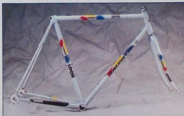
Look Génération 4.

En resumen, Look ha buscado en 1990 reforzar la gama baja de bicicletas de carretera. En el '91, su objetivo será el Mountain Bike.